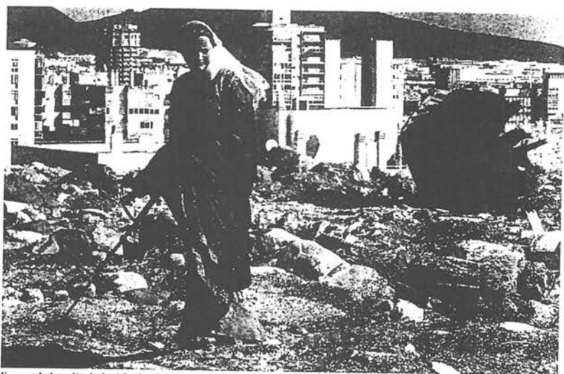
Escena de la película La isla donde duerme La Edad de Oro.